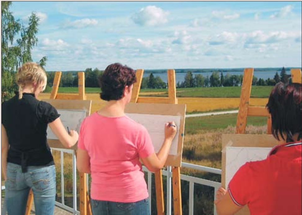
Lakeutta ikuistamassa Nelimarkka-museon työpäivässä Alajärvellä.