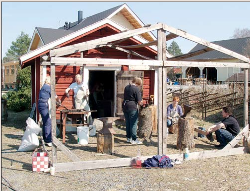
Uutelan Tainan taontapajakurssilaiset työn toubussa.

tanut hankkeen, jossa verkostoituminen muiden alan toimijoiden kanssa on arvokas piirre. Toisilta voi saada tukea, heiltä voi saada neuvoja, heidän kanssa voi ihmetellä ja löytää aina uutta. Toiminta jatkokoon!