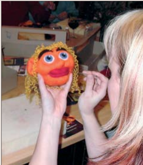
Neulabuovutusta Etelä-Pohjanmaan käsi- ja taideteollisuus ry:n malliin.

Ongelmia syntyy myös eräänlaisesta näköalattomuudesta ja rohkeuden puutteesta suhteessa tykypalvelujen tuottamisen tulevaisuuden mahdollisuuksiin. Kuuntelemalla asiakasta ja analysoimalla tarkemmin haluttuja kohderyhmiä on kuitenkin mahdollista tuottaa selvästi vahvempia tykyelä-