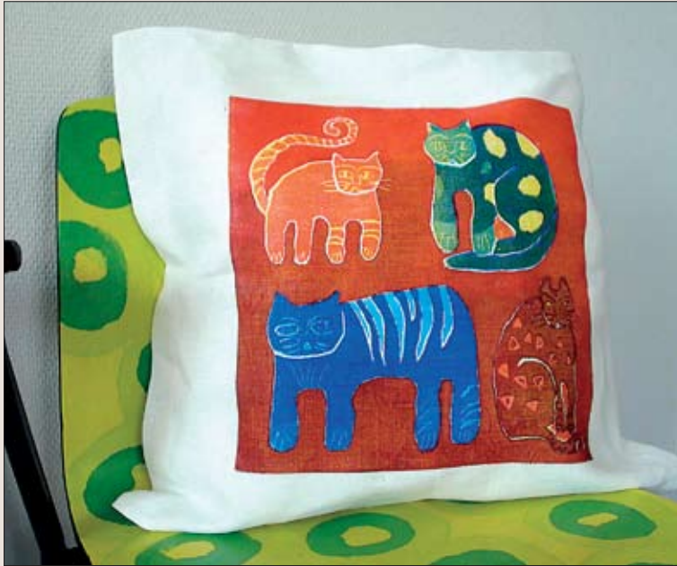
Etelä-Pohjanmaan käsi- ja taideteollisuus ry:n Tyyny tarinoi -kurssin satoa.

markkinointi on rankkaa, voivat olla yhteismarkkinoinnissa mukana ja saamassa vertaistukea.