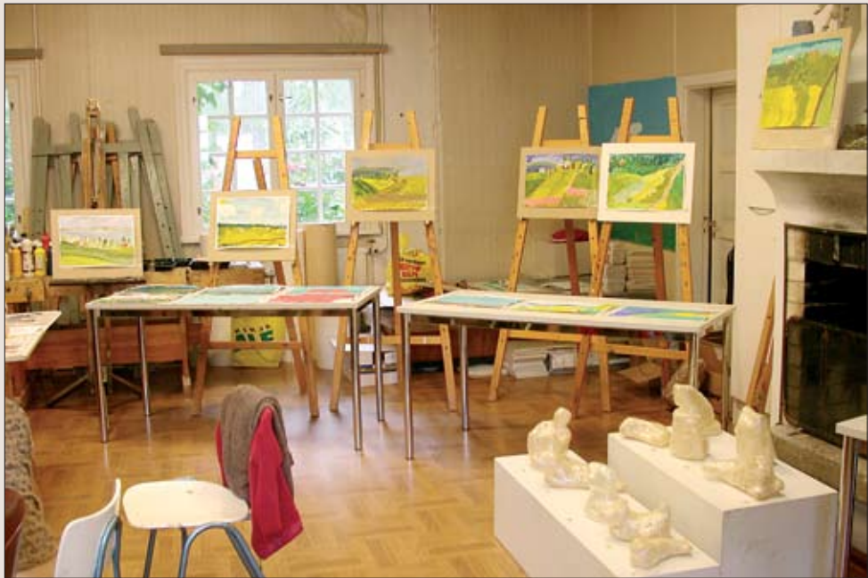
Nuorten kuvataidetta Nelimarkka-museolla Alajärvellä.