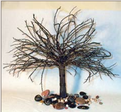
Etelä-Pohjanmaan käsi- ja taideteollisuus ry:n Elämänpuu.