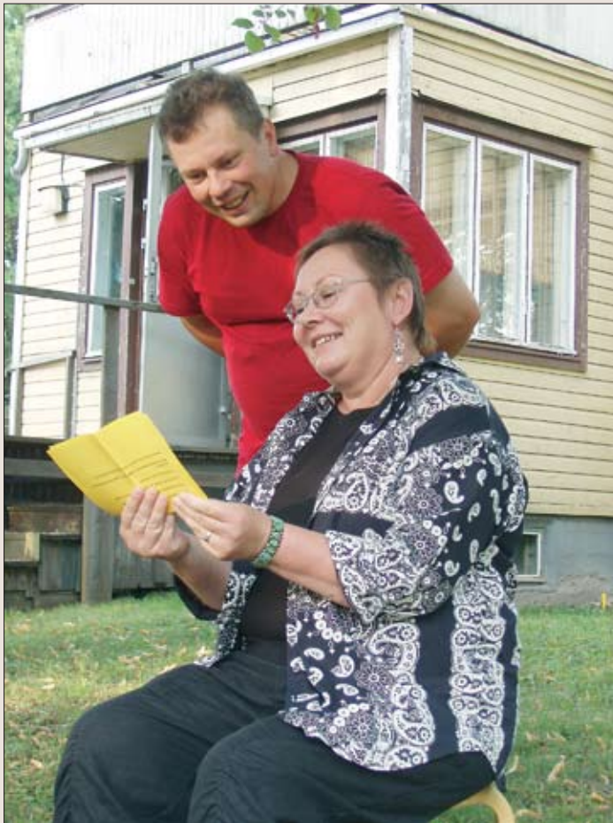
Hankkeen osallistujan, Pobjanmaan kirjailijat ry:n, kirjavinkkausta.

pääosin positiivisena. Joillekin kuitenkin on ollut pettymyksenä se, ettei kulttuuripakettien menekki ollutkaan odotuksia vastaava. Muutama koki, ettei ole saanut hankkeessa mukana olemisestaan omaan toimintaansa juurikaan hyötyä, toisaalta he kuitenkin myöntävät, etteivät ole osallistuneet hankkeen toimintaan aktiivisesti tai markkinoineet omia kulttuuripakettejaan riittävästi.